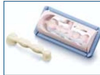
GEFRÄSTER ZIRKONOXID-ROHLING UND GESINTERTES BRÜCKENGERÜST

oder Brücke herausgearbeitet wird. Zum Schluss bekommt die Arbeit ihr gewünschtes Aussehen durch die Verblendung mit einer Keramik in Ihrer individuellen Zahnfarbe. Und damit das System sicher und reibungslos funktioniert, kommt alles aus einer Hand – von DeguDent.