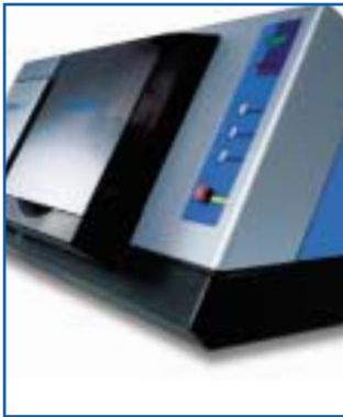
SCAN- UND FRÄSEINHEIT

Erst durch die Weiterentwicklung einer Forschungsarbeit der renommierten Eidgenössischen Technischen Hochschule Zürich ist es möglich, diesen Werkstoff wirtschaftlich in der Dental-Technik einzusetzen.