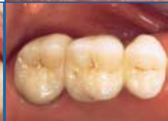
FRONT- UND SEITENZAHN- RESTAURATIONEN AUS CERCON